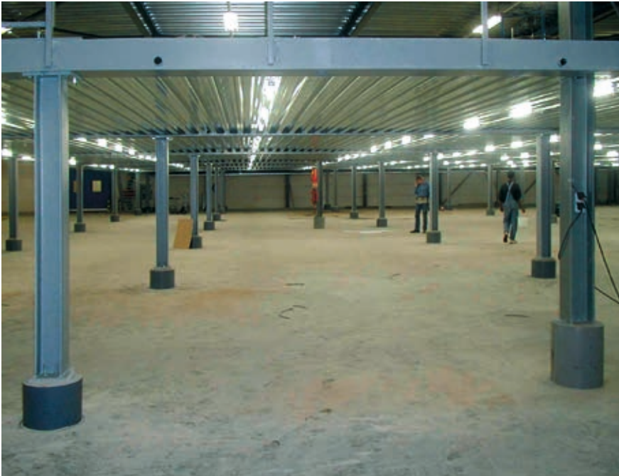
Aufbau einer HODY-Verbunddecke für ein Bürogeschoss

HODY® ist ein trapezförmiges, profiliertes Stahlplattenprofil zur Herstellung von Verbunddecken. Die Profilhöhe beträgt 60 mm. Die Platten sind für die Herstellung von sogenannten „niedrigen“ Stahlverbundböden bestimmt. Die Höhe des fertigen Betonbodens beträgt zwischen 110 und 290 mm. Die freie Spannweite der Tragkonstruktion darf in Ausnahmefällen über 9 Meter betragen.